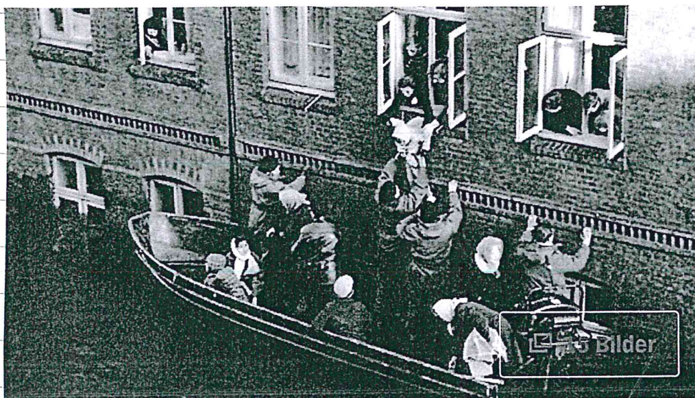
Rettende Engel und helfende Hamburger

Aus meiner Sicht ist er eine bemerkenswerte Person, da man heute oft nur Leute trifft, die in erster Linie an sich denken und dann erst an die anderen.